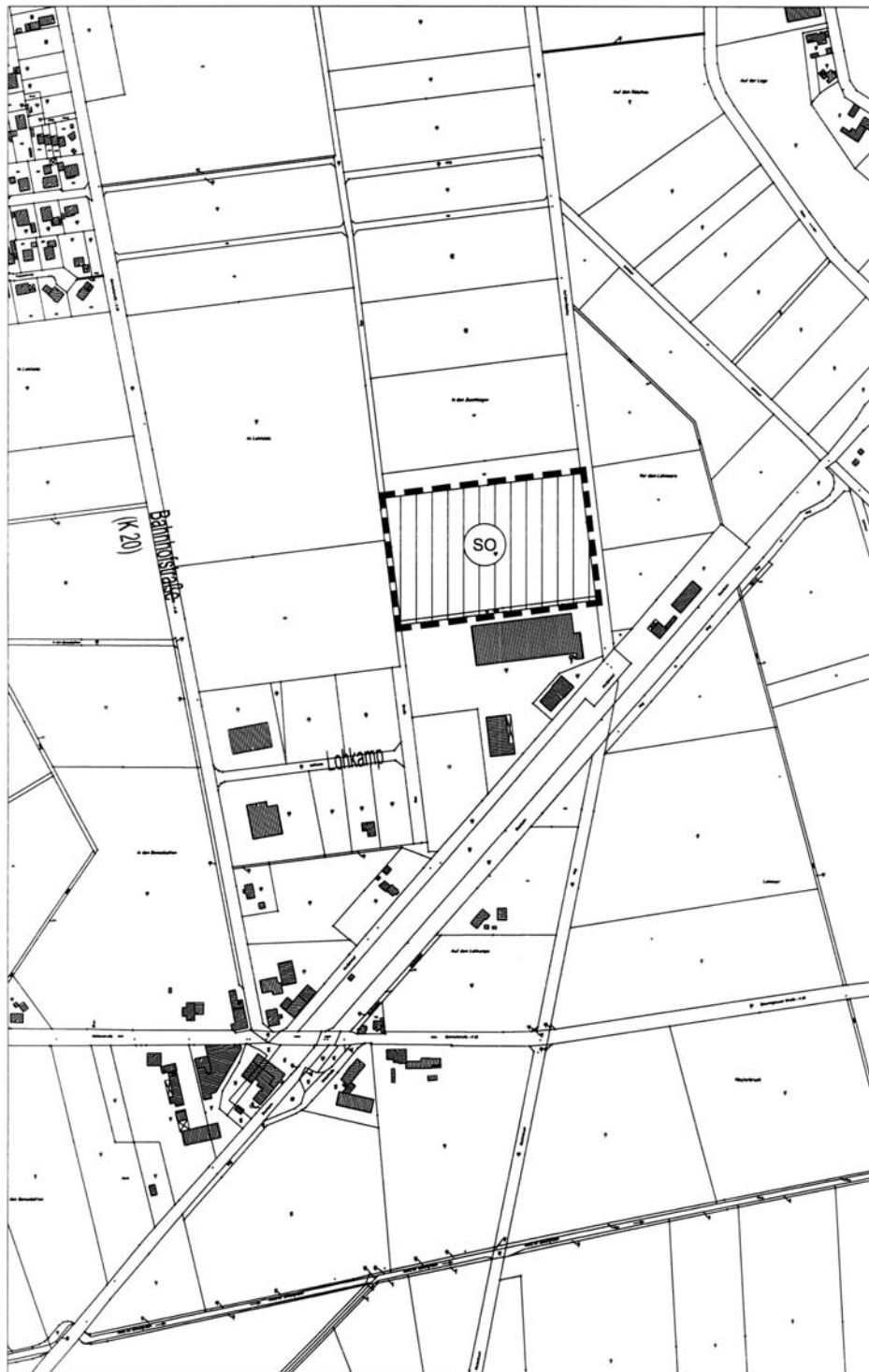
Sondergebiet in der Gemeinde Varrel