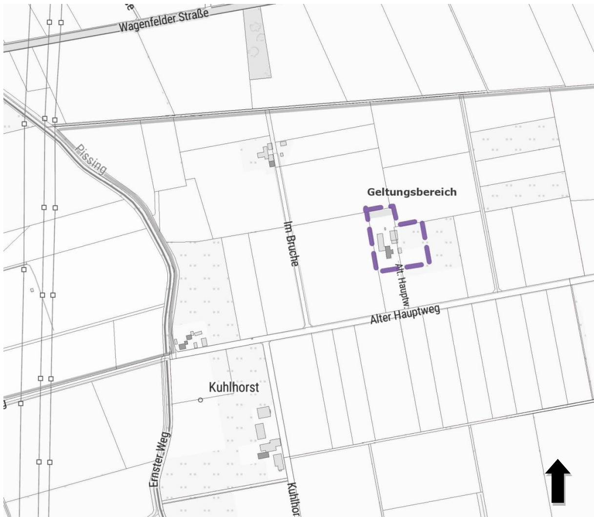
Übersichtskarte Bebauungsplan Nr. 16 „Gewerbegebiet „Alter Hauptweg 56“ (unmaßstäblich)

Das Plangebiet umfasst die ehemalige Hofstelle „Alter Hauptweg 56“ im Norden der Gemeinde Hüne. Das bisher im Außenbereich gelegene Anwesen wird durch die Straße „Alter Hauptweg“ erschlossen, die sich südlich der „Wagenfelder Straße (L345)“ und nördlich der „Düversbrucher Straße“ befindet und umfasst die beiden Flurstücke 23/3 und 25/2, der Flur 18, Gemarkung Hüne teilweise. Zur genauen Abgrenzung wird auf den beigefügten Plan mit Darstellung des Geltungsbereiches in Form einer gestrichelten Linie verwiesen.